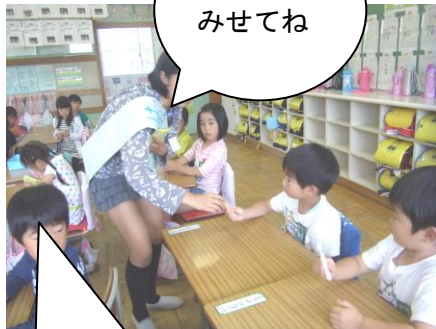
歯ブラシ みせてね